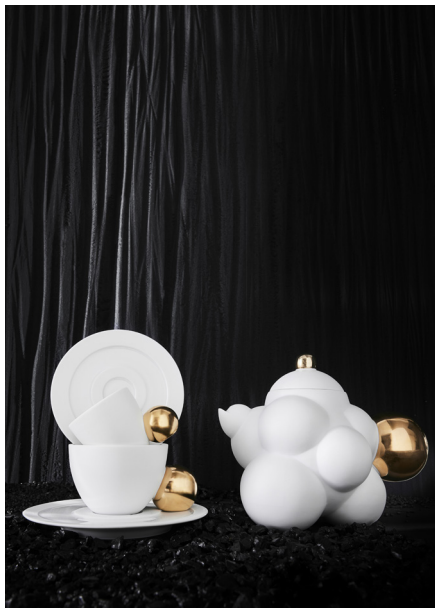
SERVICE À THÉ ET CAFÉ ET VERSEUSE COFFEE AND TEA SET WITH A COFFEE POT