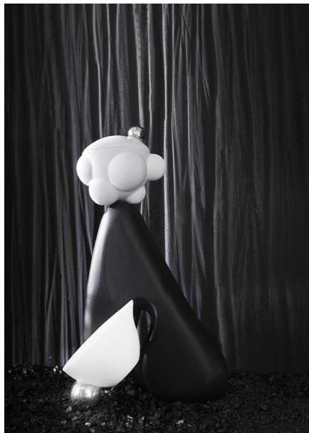
CRÉMIER ET SUCRIER CREAMER AND SUGAR BOWL