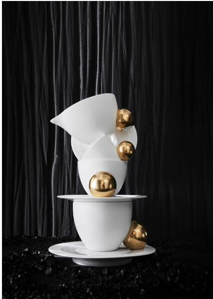
SERVICE À THÉ ET CAFÉ ET CRÉMIER TEA AND COFFEE SET AND CREAMER